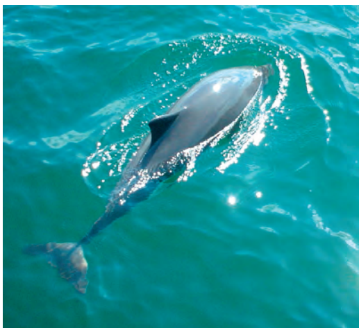
Havaintoja Itämeren pyöriäisestä kerätään jälleen