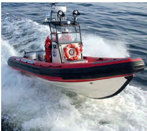
Vapaaehtoiset meripelastajat valmiina auttamaan